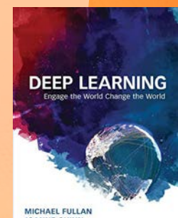
Deep Learning: Involucrar al mundo, cambiar el mundo. (2017)